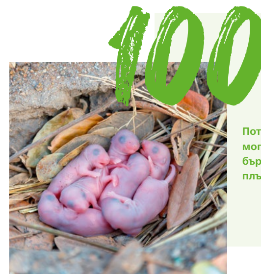
Потомци годишно могат да се натрупат бързо за всеки плъх от женски пол.